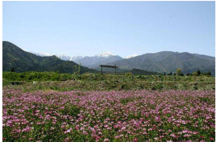
安曇野から見た常念岳

又、会員同士のフリートークの時間も設けてお ります。 情報交換やお互いの悩みなどを語り 合える場にしたいと思っています。